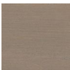
1142 Графит серебро