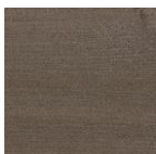
1143 Оникс серебро